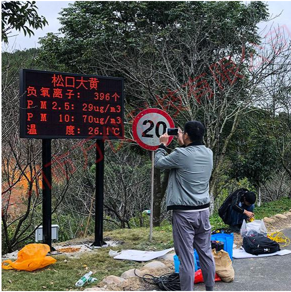
单色屏+双立柱固定