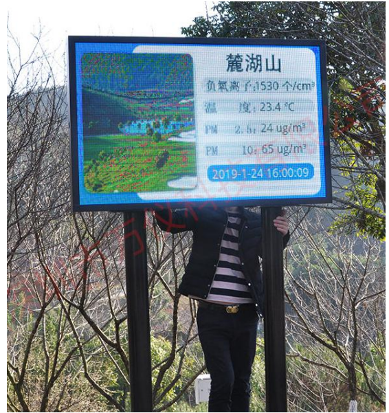
全彩屏+双立柱固定